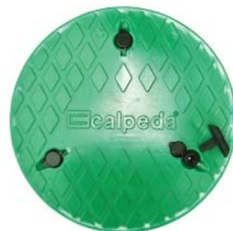
Näpsä 500 Green pumppaamon nero-kas lukittava kansi.